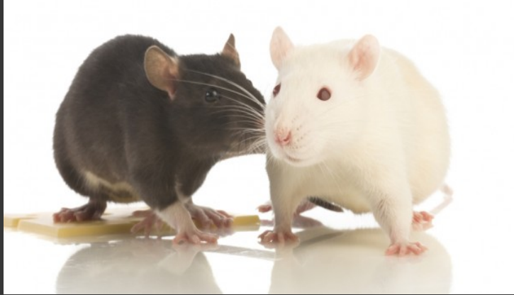
Myši a potkani